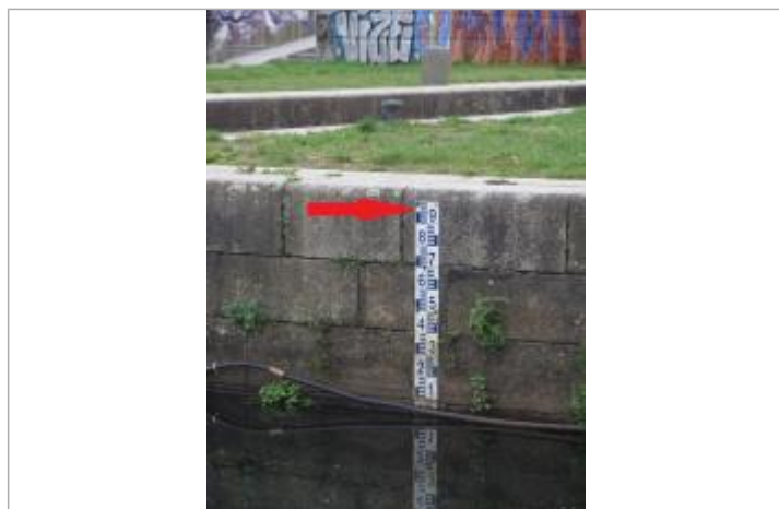
Ecluse St-Martin à Rennes - échelle amont

Altitude calculée de l'eau (en m) : 27.2 m