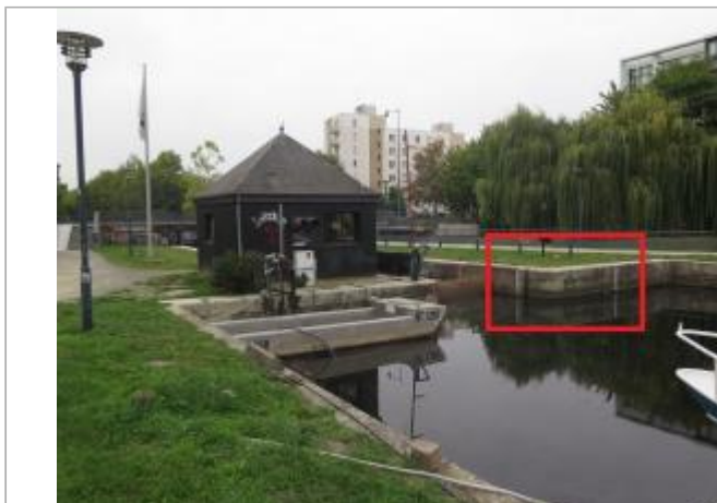
Echelles amont de l'écluse de Saint Martin à Rennes