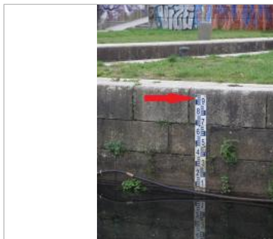
Ecluse St-Martin à Rennes - échelle amont