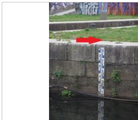
Ecluse St-Martin à Rennes - échelle amont