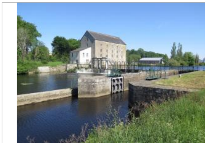
Aval de l'écluse de Signan - St Michel à Pontivy (échelle disparue)

Altitude calculée de l'eau (en m) : 51.93