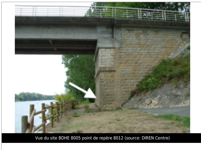
Vue du site BDHE 8005 point de repère 8012