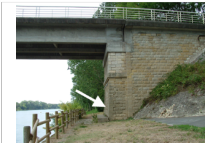
Vue du site BDHE 8005 point de repère 8012

Coordonnées WGS84 : X: 0.53202319 / Y: 47.08077810