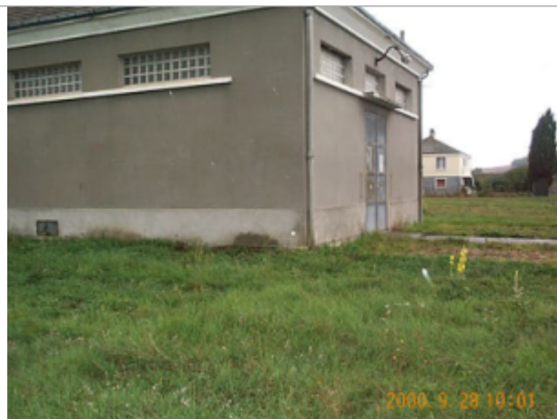
Vue du site BDHE 8001 point de repère 8002

Coordonnées WGS84 : X: 0.56278224 / Y: 47.01115400