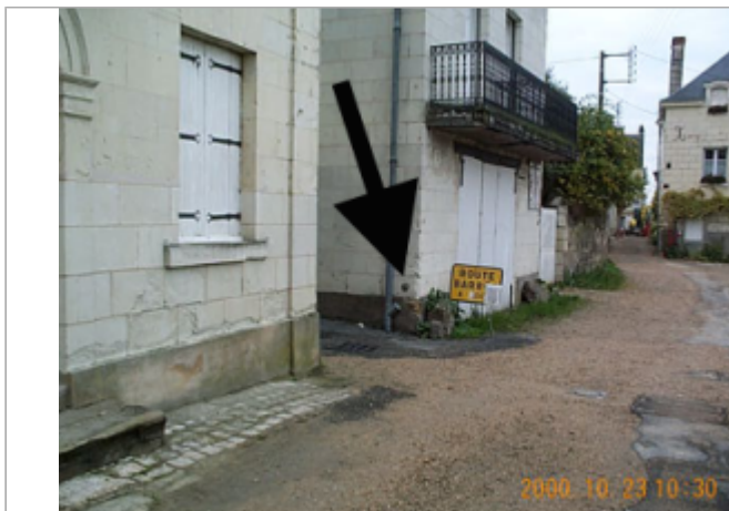
Vue du site BDHE 8022 point de repère 8048