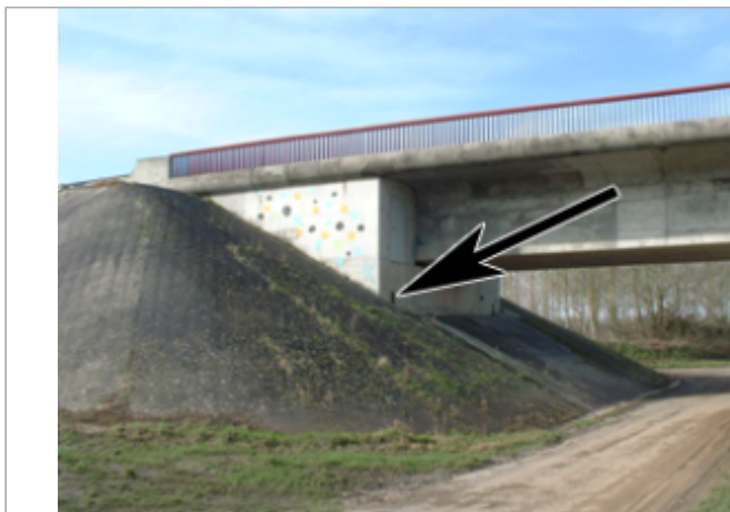
Vue du site BDHE 8019 point de repère 8041