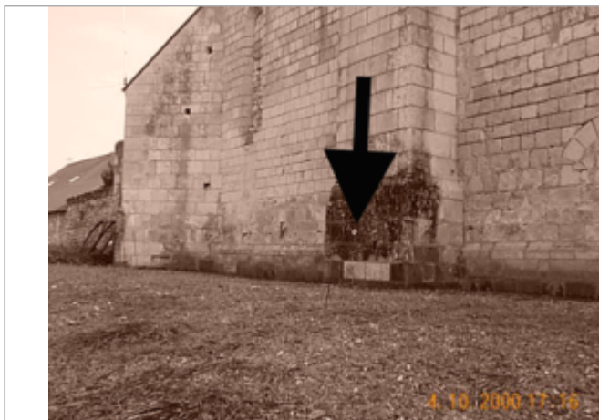
Vue du site BDHE 8013 point de repère 8031