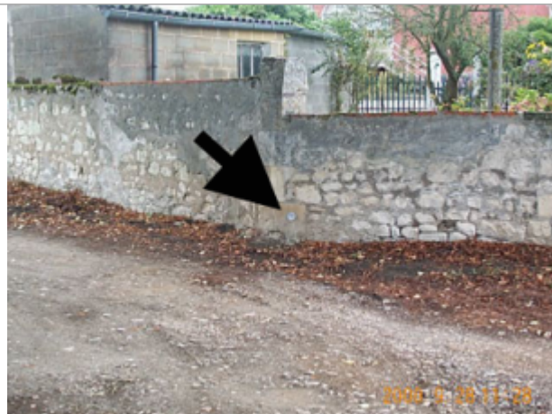
Vue du site BDHE 8002 point de repère 8005