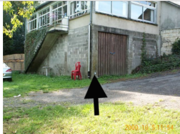
Vue du site BDHE 8021 point de repère 8046