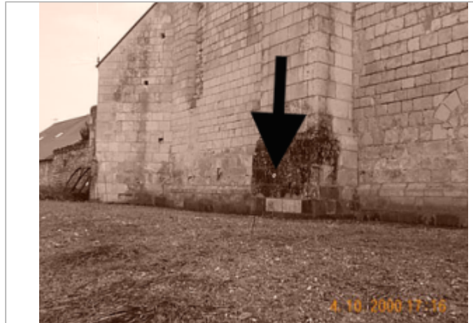
Vue du site BDHE 8013 point de repère 8031

Coordonnées WGS84 : X: 0.34149700 / Y: 47.13575100