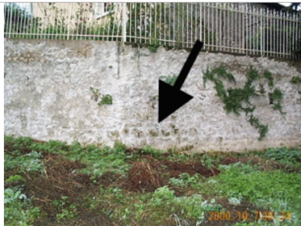
Vue du site BDHE 8012 point de repère 8029