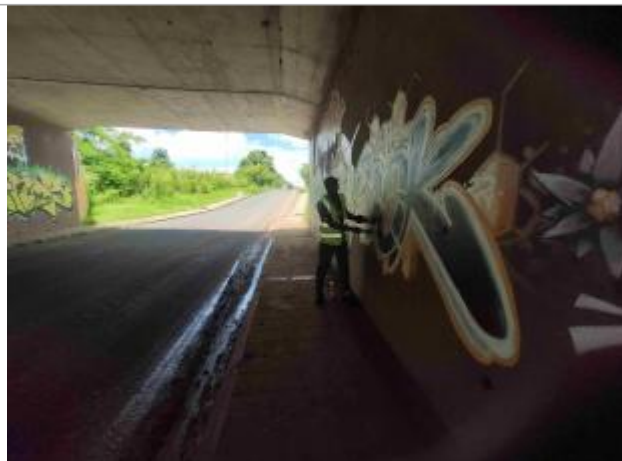
vue d'ensemble sous le pont