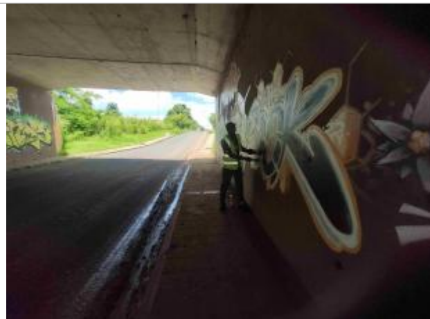
vue d'ensemble sous le pont

Coordonnées WGS84 : X: -61.51487900 / Y: 16.27152670