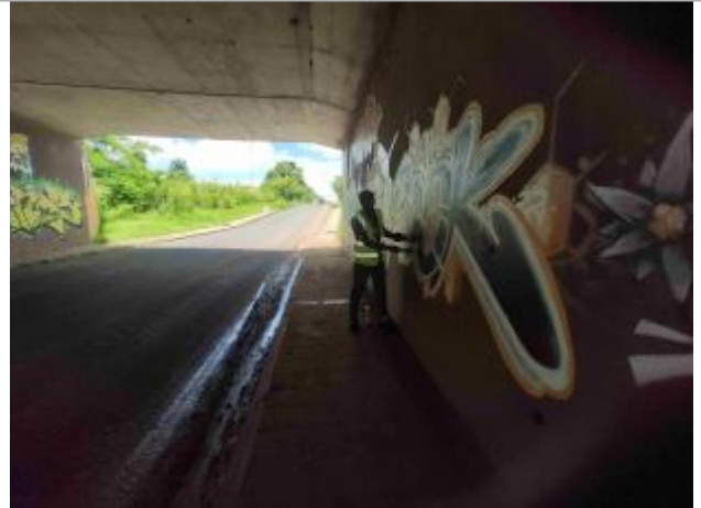
vue d'ensemble sous le pont