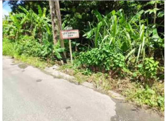
Vue d'ensemble section bois à diable route C305