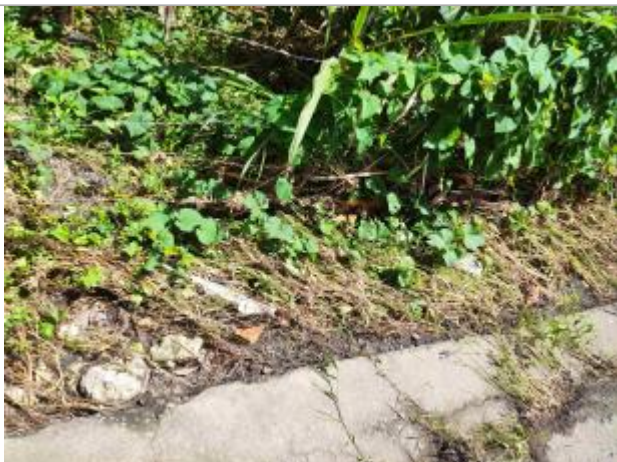
Aplatissement de la végétation

Type de repérage : Campagne de terrain post-inondation