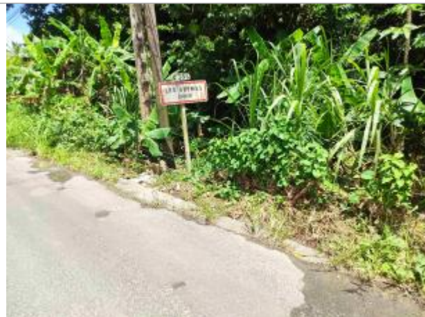
Vue d'ensemble section bois à diable route C305