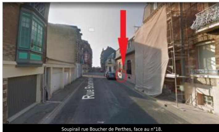
Soupirail rue Boucher de Perthes, face au n°18.

Coordonnées WGS84 : X: 1.38197426 / Y: 50.06573300