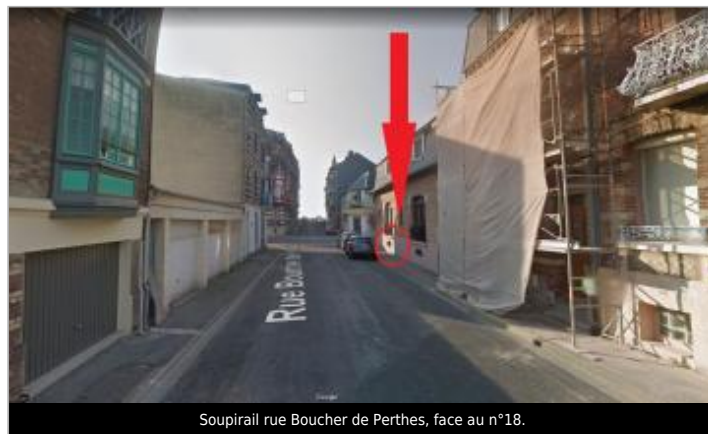
Soupirail rue Boucher de Perthes, face au n°18.

GÉOLOCALISATION Coordonnées WGS84 : X: 1.38197426 / Y: 50.06573300 Coordonnées RGF93 (Lambert 93) X: 584044.24 / Y: 6997561.63 Coordonnées RGF93 (ETRS89) : X: 1.3819743 / Y: 50.065733 Code Hydro: Q0000630 Rive de référence: