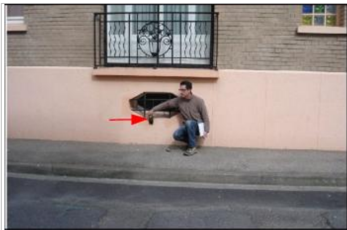
Laisse de mer au niveau du bord inférieur du soupirail.