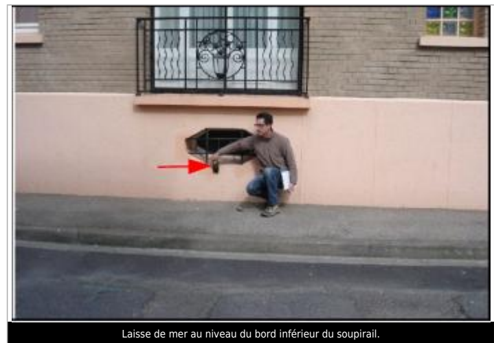
Laisse de mer au niveau du bord inférieur du soupirail.

MARQUE Maximum de l'inondation : Oui Visibilité : Non État du repère : Disparu Pérennité : Aucune