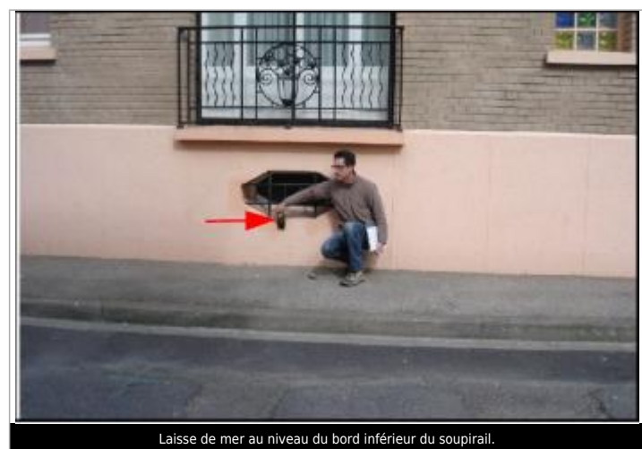
Laisse de mer au niveau du bord inférieur du soupirail.