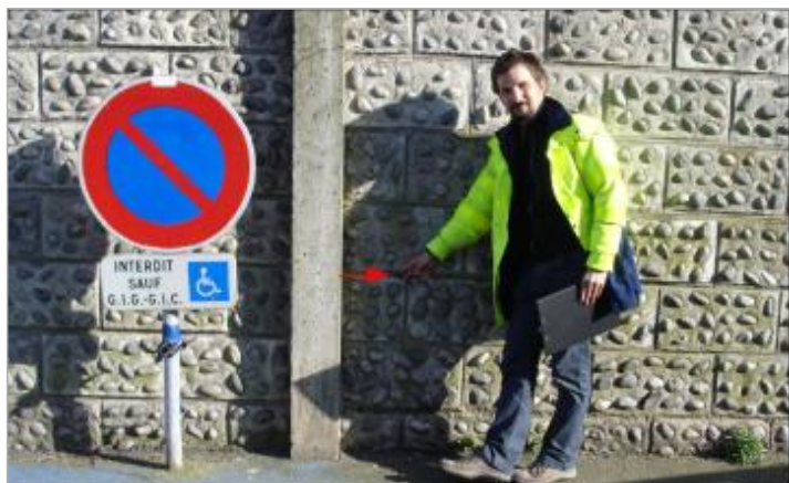
Laisse de mer au niveau du haut de la 3 ème rangée de pierres.