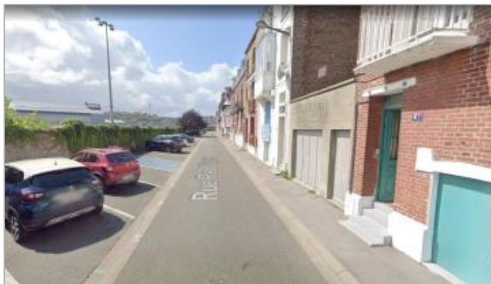
Mur d'enceinte du stade, face au n°43 rue Paul Viguier

Coordonnées WGS84 : X: 1.38296167 / Y: 50.06500710