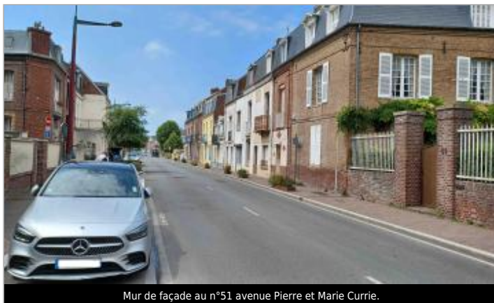
Mur de façade au n°51 avenue Pierre et Marie Currie.