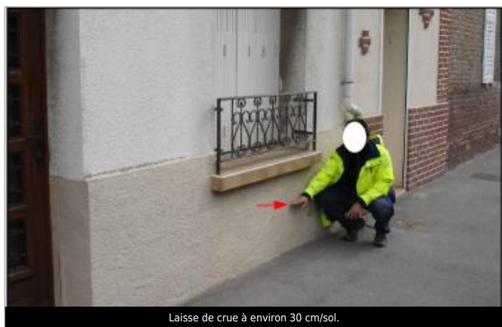
Laisse de crue à environ 30 cm/sol.