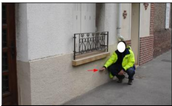
Laisse de crue à environ 30 cm/sol.