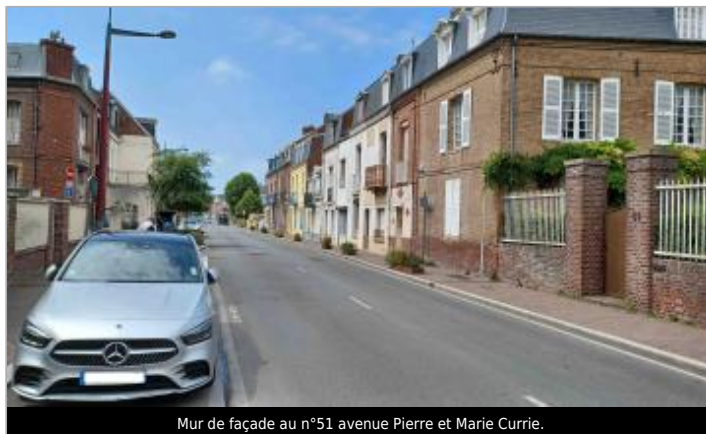
Mur de façade au n°51 avenue Pierre et Marie Currie.