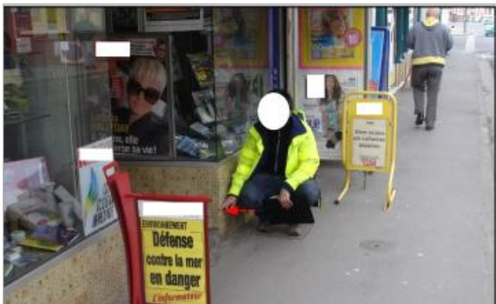
Laisse de crue à 20 cm/sol.