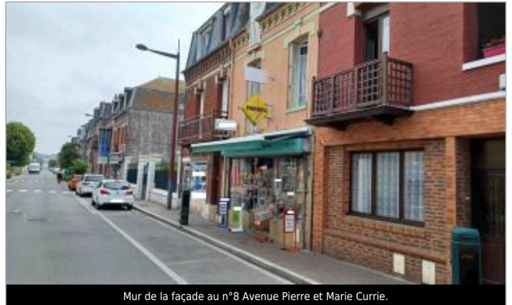
Mur de la façade au n°8 Avenue Pierre et Marie Currie.

Coordonnées WGS84 : X: 1.38787389 / Y: 50.06591540