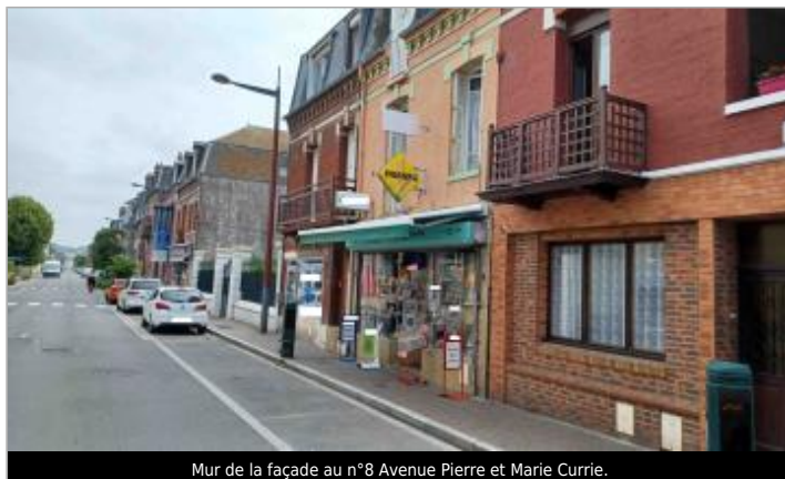
Mur de la façade au n°8 Avenue Pierre et Marie Currie.

Coordonnées WGS84 : X: 1.38787389 / Y: 50.06591540