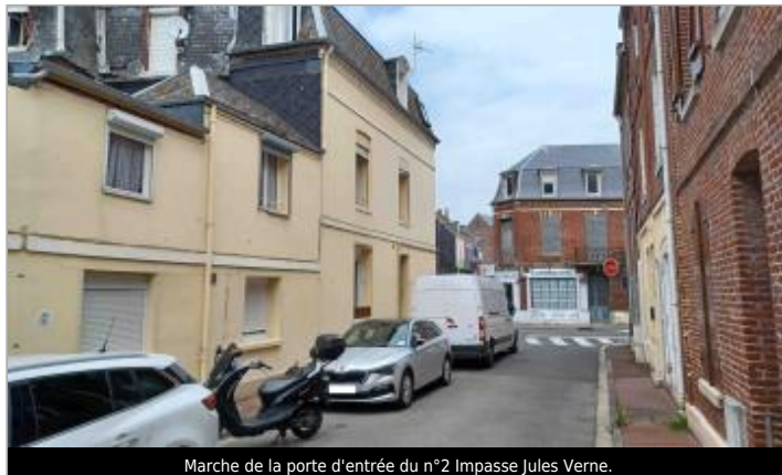
Marche de la porte d'entrée du n°2 Impasse Jules Verne.