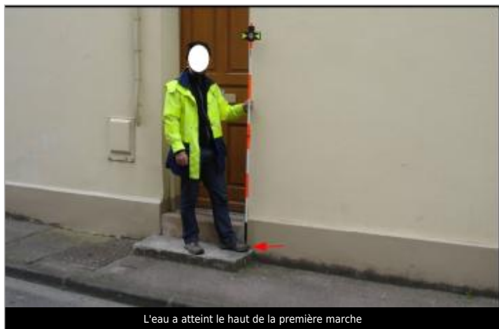
L'eau a atteint le haut de la première marche