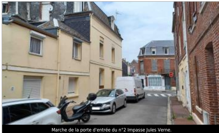
Marche de la porte d'entrée du n°2 Impasse Jules Verne.