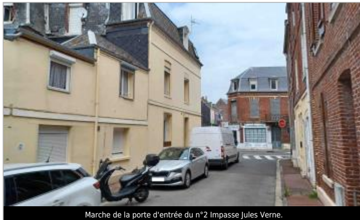
Marche de la porte d'entrée du n°2 Impasse Jules Verne.