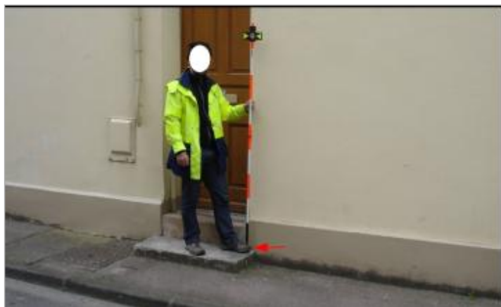
L'eau a atteint le haut de la première marche