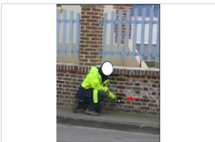
Laisse de crue au niveau de la 3ème rangées de briques

MARQUE Maximum de l'inondation : Oui Visibilité : Non État du repère : Disparu Pérennité : Aucune