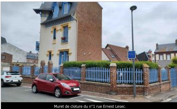
Muret de clôture du n°1 rue Ernest Lesec.

GÉOLOCALISATION Coordonnées WGS84 : X: 1.38921727 / Y: 50.06564280 Coordonnées RGF93 (Lambert 93) X: 584563.04 / Y: 6997540.97 Coordonnées RGF93 (ETRS89) : X: 1.3892173 / Y: 50.0656428 Code Hydro: Q0000630 Rive de référence: