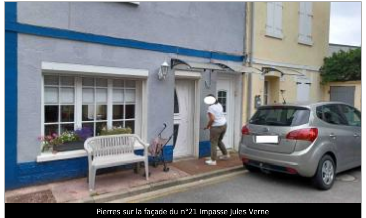
Pierres sur la façade du n°21 Impasse Jules Verne

Code : WEB_S_202211083951_1_1_1_1_1_1_1 Date de mise à jour : 05/09/2022 Auteur : SPC.SACN