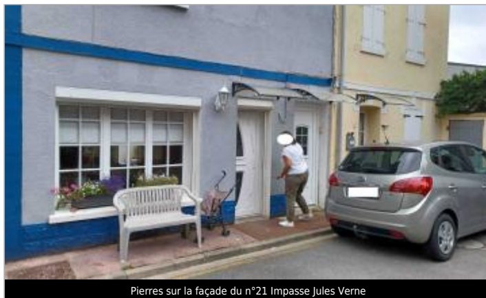
Pierres sur la façade du n°21 Impasse Jules Verne