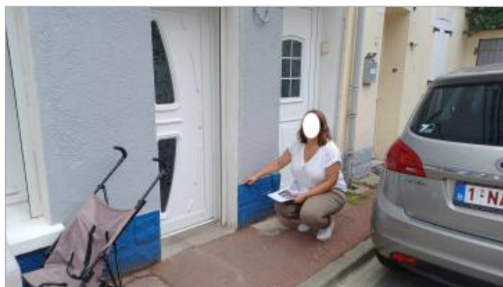
L'eau est arrivée au niveau du haut de la 2ème rangées de pierres sur la façade.