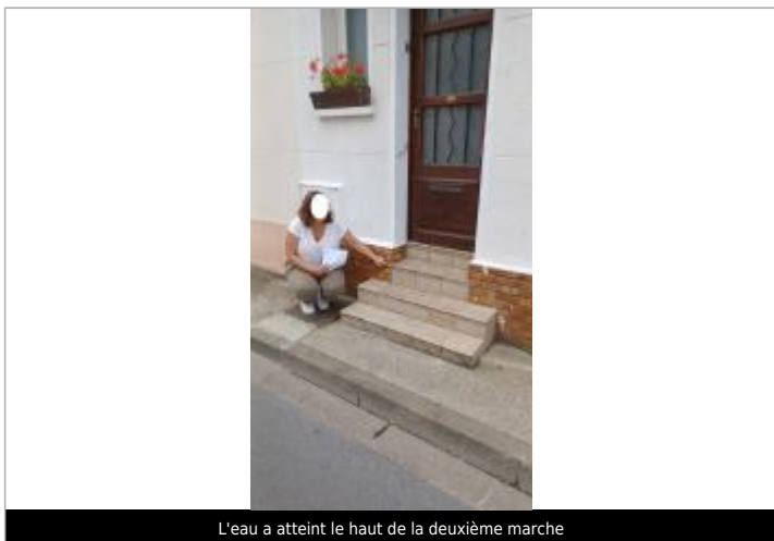
L'eau a atteint le haut de la deuxième marche

Maximum de l'inondation : Oui Visibilité : Non État du repère : Disparu Pérennité : Aucune