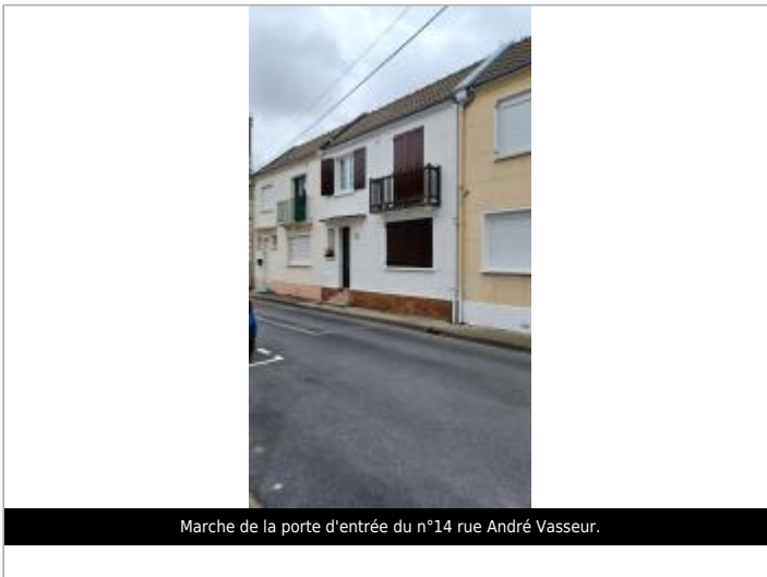
Marche de la porte d'entrée du n°14 rue André Vasseur.