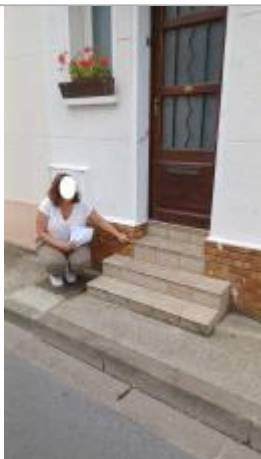
L'eau a atteint le haut de la deuxième marche