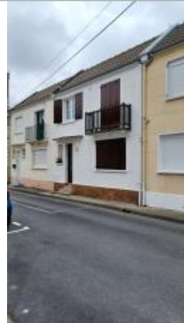
Marche de la porte d'entrée du n°14 rue André Vasseur.