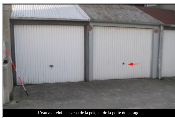
L'eau a atteint le niveau de la poignet de la porte du garage.