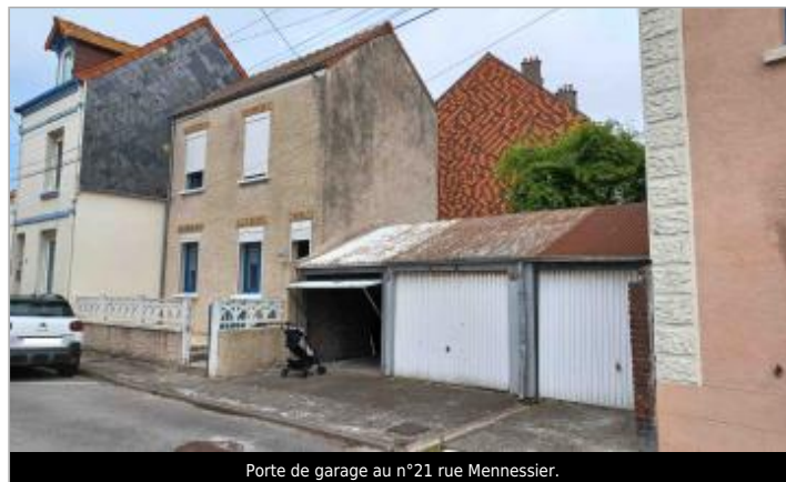
Porte de garage au n°21 rue Mennessier.

GÉOLOCALISATION Coordonnées WGS84 : X: 1.39051383 / Y: 50.06462880 Coordonnées RGF93 (Lambert 93) : X: 584653.64 / Y: 6997426.2 Coordonnées RGF93 (ETRS89) : X: 1.3905138 / Y: 50.0646288 Code Hydro: Q0000630 Rive de référence: