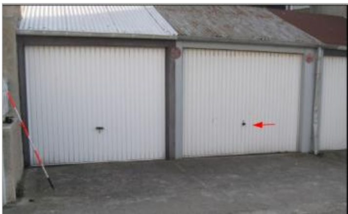
L'eau a atteint le niveau de la poignet de la porte du garage.

MARQUE Maximum de l'inondation : Oui Visibilité : Non État du repère : Disparu Pérennité : Aucune