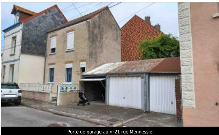
Porte de garage au n°21 rue Mennessier.

GÉOLOCALISATION Coordonnées WGS84 : X: 1.39051383 / Y: 50.06462880 Coordonnées RGF93 (Lambert 93) X: 584653.64 / Y: 6997426.2 Coordonnées RGF93 (ETRS89) : X: 1.3905138 / Y: 50.0646288 Code Hydro: Q0000630 Rive de référence: