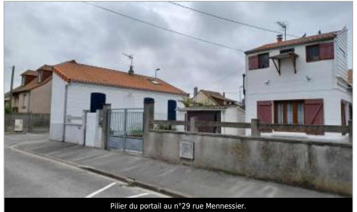
Pilier du portail au n°29 rue Mennessier.

Coordonnées WGS84 : X: 1.39076222 / Y: 50.06420930