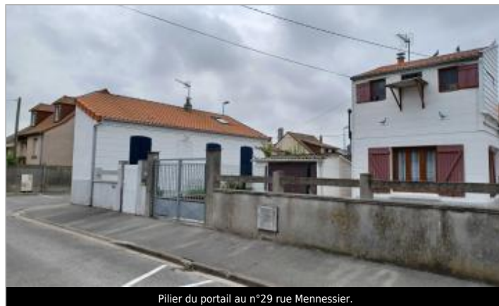
Pilier du portail au n°29 rue Mennessier.