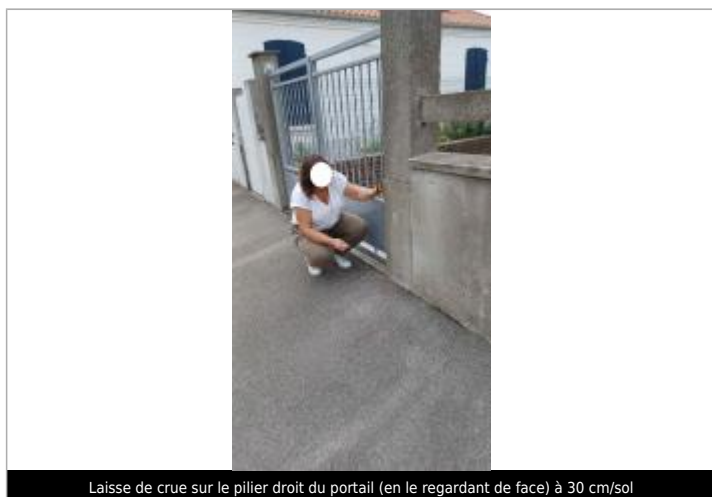
Laisse de crue sur le pilier droit du portail (en le regardant de face) à 30 cm/sol

Maximum de l'inondation : Oui Visibilité : Non État du repère : Disparu Pérennité : Aucune