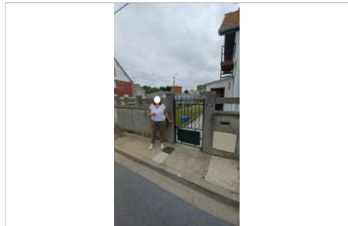
Laisse de crue sur le pilier du portail en ciment, située en haut du bardage.

MARQUE Maximum de l'inondation : Oui Visibilité : Non État du repère : Disparu Pérennité : Aucune