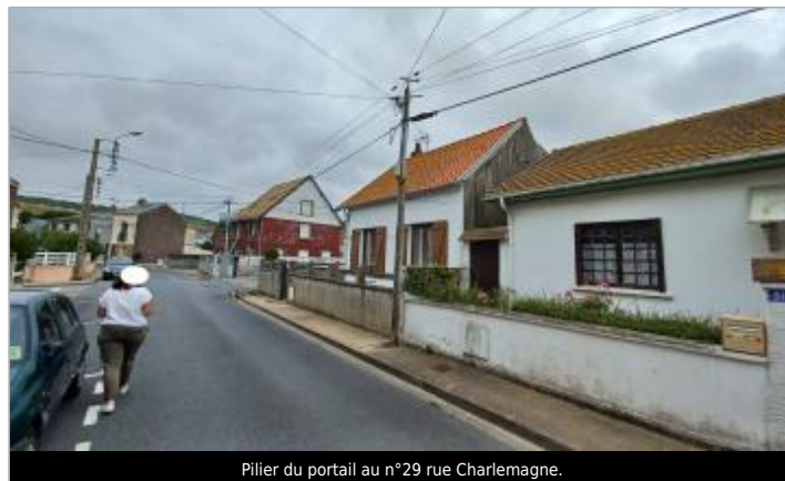
Pilier du portail au n°29 rue Charlemagne.

GÉOLOCALISATION Coordonnées WGS84 : X: 1.39054572 / Y: 50.06437680 Coordonnées RGF93 (Lambert 93) X: 584655.35 / Y: 6997398.1 Coordonnées RGF93 (ETRS89) : X: 1.3905457 / Y: 50.0643768 Code Hydro: Q0000630 Rive de référence: