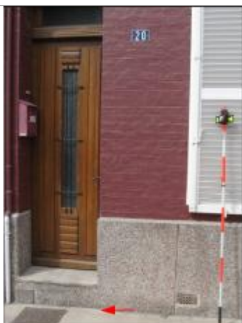
Laisse sur le seuil de la marche

Altitude calculée de l'eau (en m) : 5.17 m