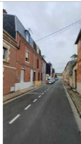
Seuil de la marche de la porte d'entrée