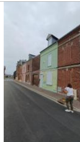
19 rue du 4 Septembre