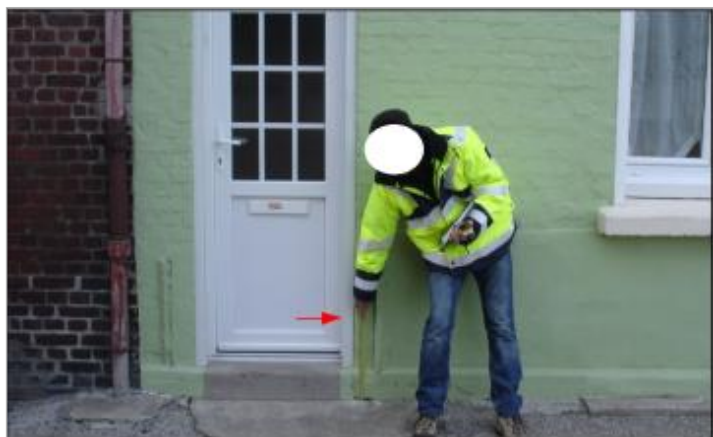
Laisse de crue sur la façade, à proximité de la porte d'entrée à 40 cm/sol.