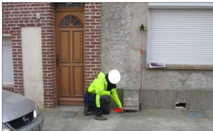
Laisse de crue au niveau du bas du coffret.