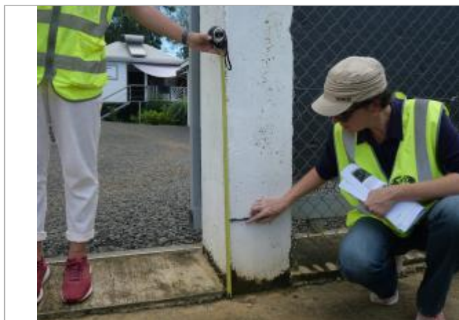
PHE = 33cm

Altitude calculée de l'eau (en m) : 3.61 m