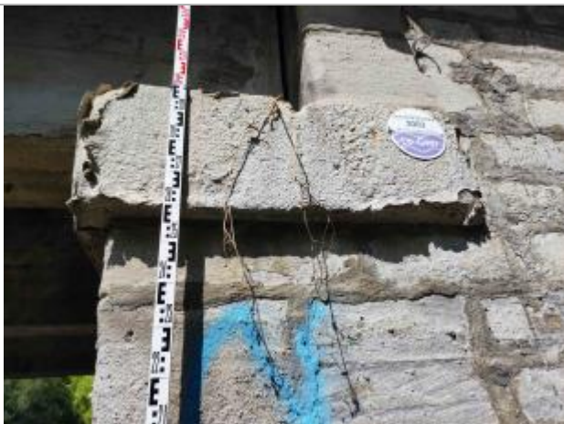
zoom sur le repère de crue posé avec une mire