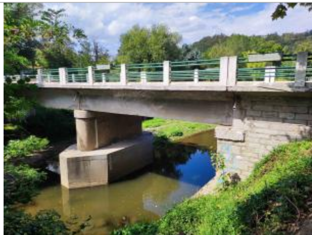
pont traversant la ville de Saint-Romain-en-Gier