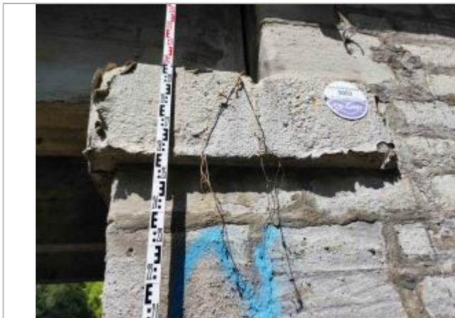
zoom sur le repère de crue posé avec une mire