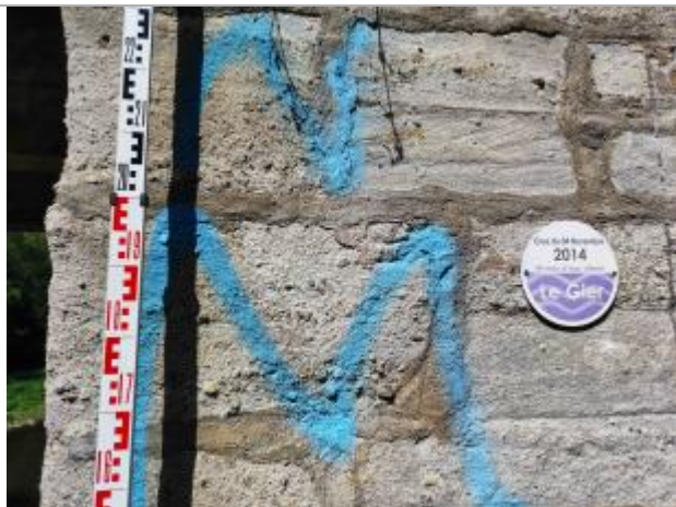
zoom sur le repère de crue posé avec une mire