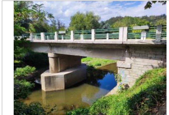
pont traversant la ville de Saint-Romain-en-Gier