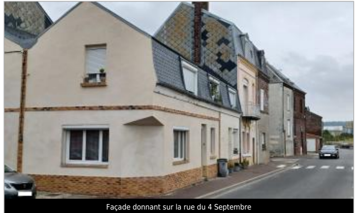
Façade donnant sur la rue du 4 Septembre