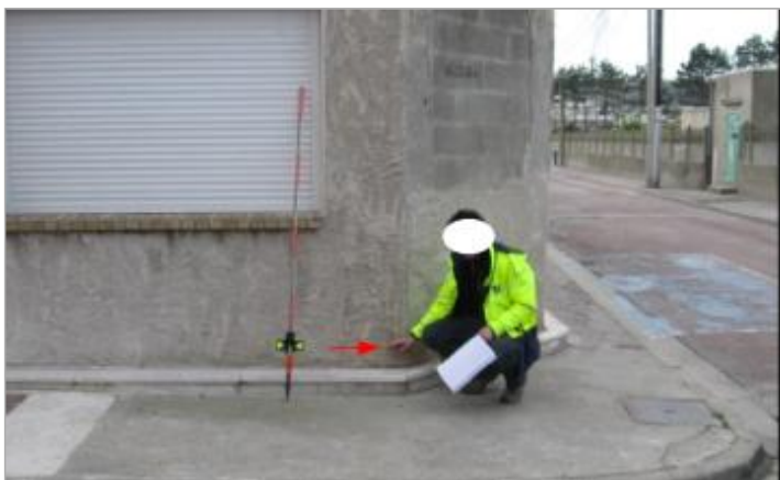
Laisse de crue sur la façade donnant rue du 4 Septembre.