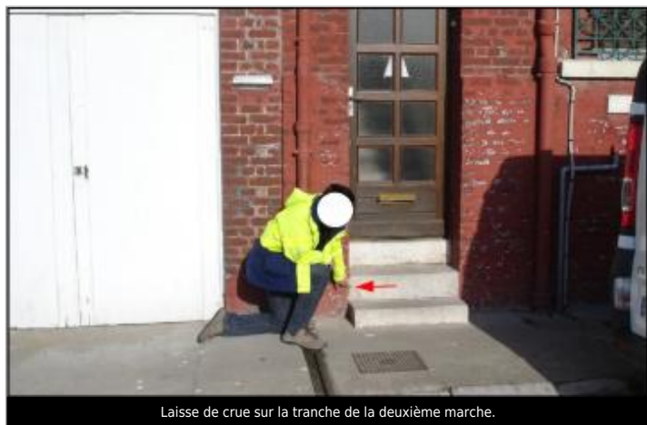
Laisse de crue sur la tranche de la deuxième marche.