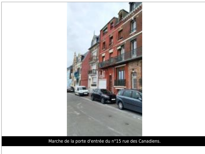
Marche de la porte d'entrée du n°15 rue des Canadiens.