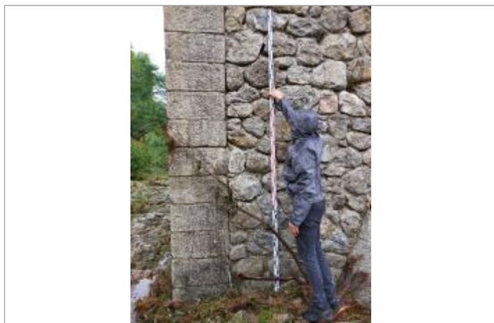
vue laisse et mesure

Différence entre le niveau d'eau et la référence (en m) : 2.300 m