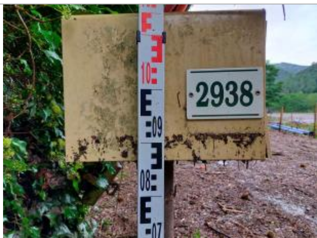
vue laisse et mesure

Différence entre le niveau d'eau et la référence (en m) : 0.050 m