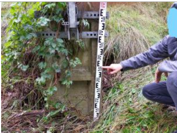
vue mesure et laisse

Différence entre le niveau d'eau et la référence (en m) : 0.550 m