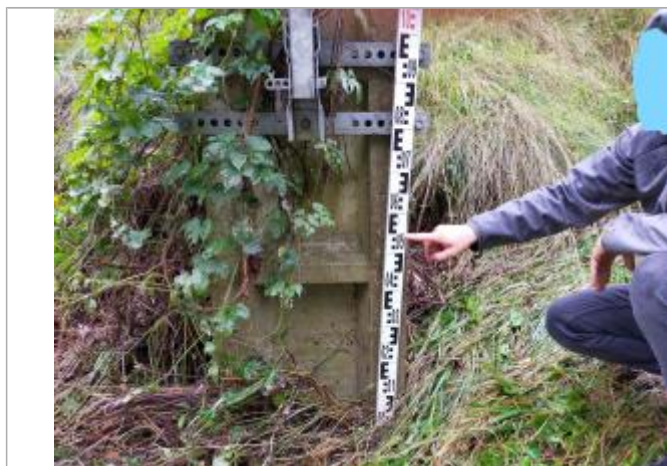
vue mesure et laisse

Différence entre le niveau d'eau et la référence (en m) : 0.550 m