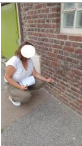
Laisse de crue au niveau de la 5ème rangée de briques.

Altitude calculée de l'eau (en m) : 6.99 m