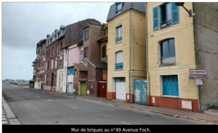
Mur de briques au n°49 Avenue Foch.

Coordonnées WGS84 : X: 1.38015610 / Y: 50.06456800