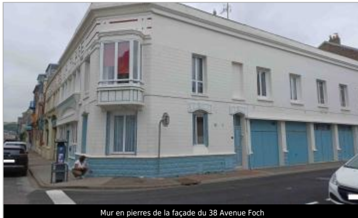
Mur en pierres de la façade du 38 Avenue Foch