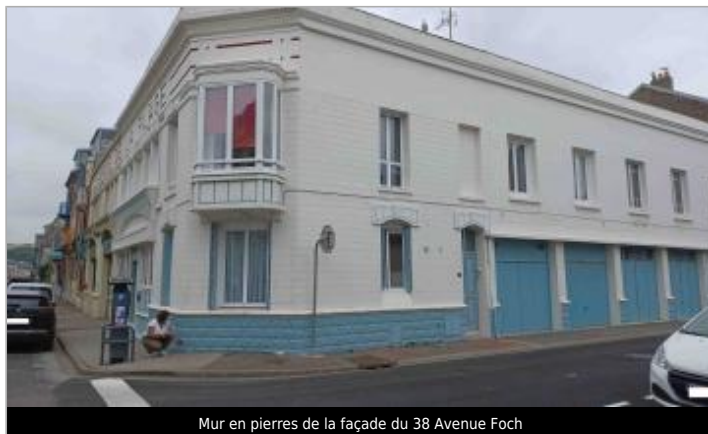
Mur en pierres de la façade du 38 Avenue Foch