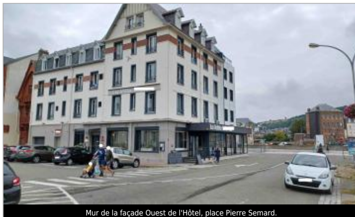
Mur de la façade Ouest de l'Hôtel, place Pierre Semard.