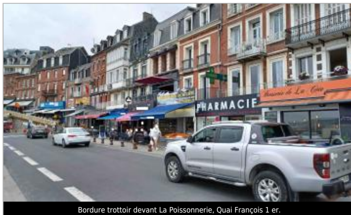
Bordure trottoir devant La Poissonnerie, Quai François 1 er.