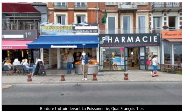
Bordure trottoir devant La Poissonnerie, Quai François 1 er.