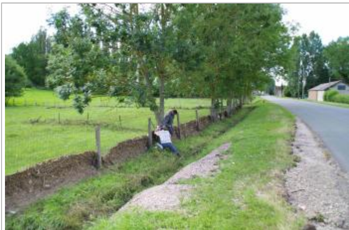
Arbre en bordure de route