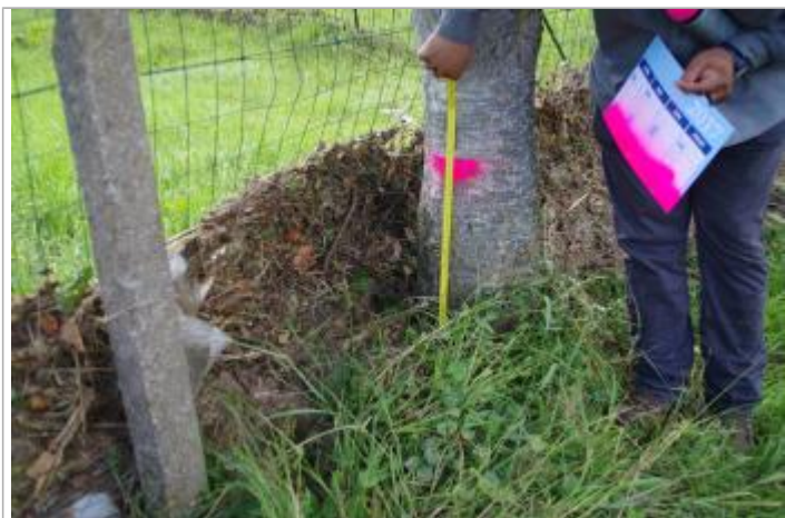
Prise de mesure depuis le pied de l'arbre

Altitude calculée de l'eau (en m) : 96.26 m